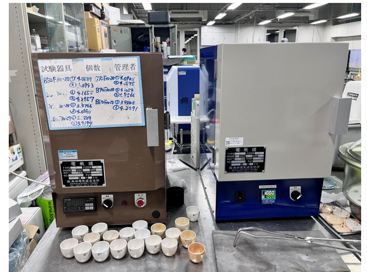
強熱減量に使用する電気炉